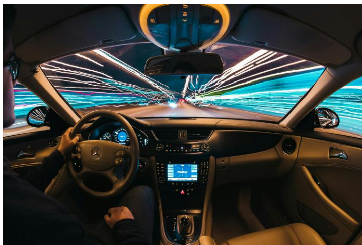
Samuele Errico Piccarini