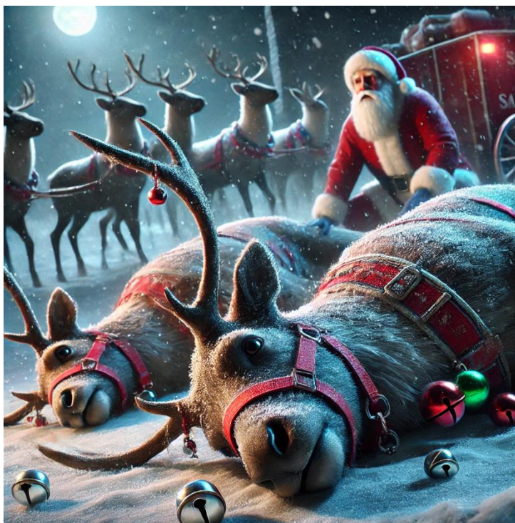
Image générée par IA

En tête des facteurs de risques : l'intensité du temps de travail suivis par les rapports sociaux et l'insécurité de la situation de travail.